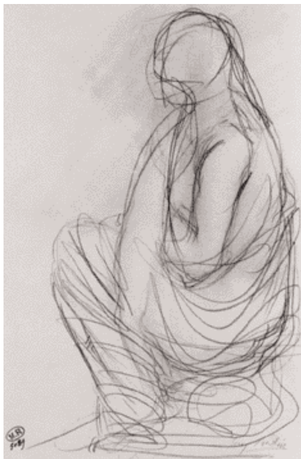
Auguste Rodin, Mujer cubierta, sedente, s/f

Situada en los momentos en que España se anexa a la invasión de Iraq, en medio de discusiones sobre el papel de España en esa guerra, mientras Néstor afirma que la única revolución verdadera es la francesa, asistimos a las constantes reflexiones del exquisito, del sibarita, del hombre pródigo en fantasías sensuales, del adorador de las mujeres, del imán de damas hermosas que en el fulgor de su éxito profesional encuentran el gozo de su poderío amatorio. Para cada dama adorada en los distintos momentos de su vida crea una pieza única. Algunas sin posibilidad de ser entregadas, como la que corresponde a Ela: el primer oro, el oro prohibido de sus tibiezas infantiles. Ofrenda a las mujeres de su vida para llegar al altar mayor, en la ple-