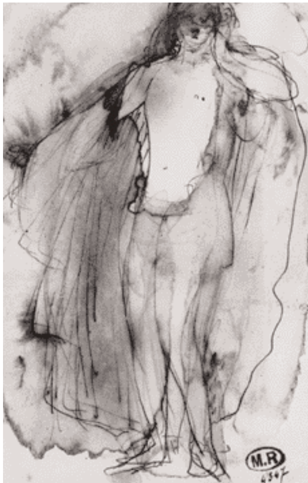
Auguste Rodin, Mujer envuelta en sus velos , s/f

nitid de los sentidos y la inteligencia, de su sabiduría amorosa, para encontrar en la juventud de “Limpito”, el joven con quien se batirá a duelo, la única amenaza irrefutable. El paso del tiempo y la decadencia son temas constantes de las preocupaciones de Rejón visibles en sus pensamientos y discusiones acerca de Lampedusa y de su propia vida.