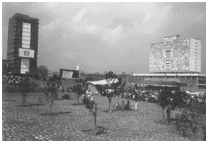
Día de la Dedicación, 20 de noviembre de 1952