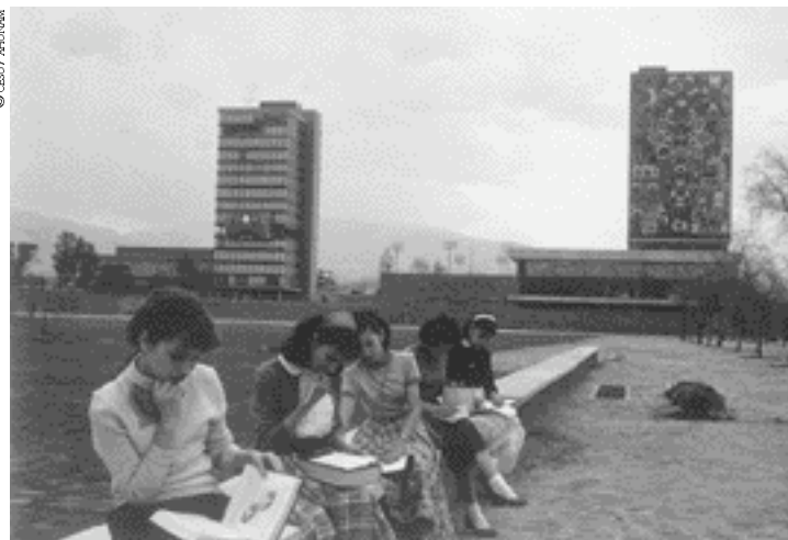
El campus, 1955

armónico de la enseñanza dirigida a la formación del estudiantado. Éste, en determinados tiempos, tiene la posibilidad de manifestar su parecer respecto de la organización de los cursos escolares. Cada maestro, en ejercicio de la autonomía universitaria, imparte su materia en plena libertad de cátedra. De todo esto se desprende que la autonomía implica que en la docencia nadie puede imponer como norma una determinada ideología.