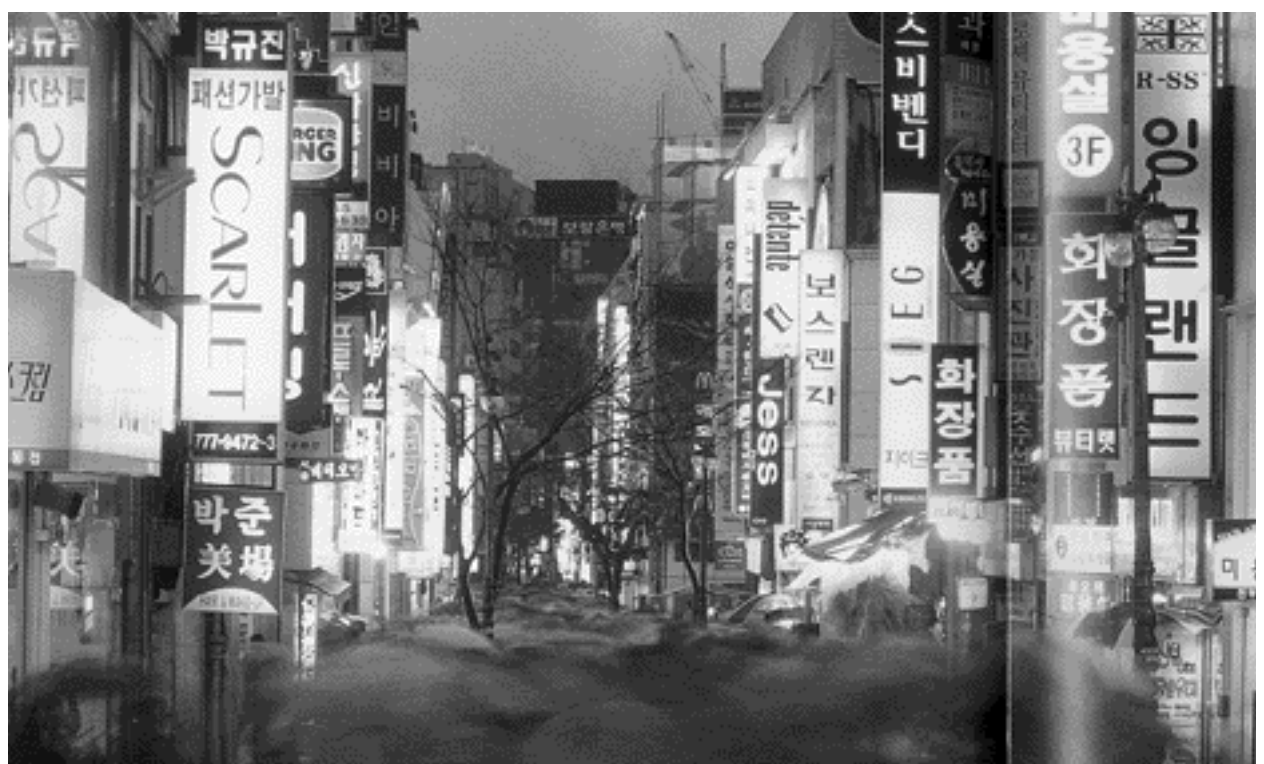
Seúl, Corea del Sur

La primera buscó redimensionar el sector público y revisar a fondo el papel del Estado en la economía, así como redefinir las relaciones comerciales y financieras