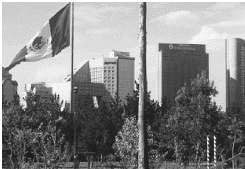
Alrededores del Bosque de Chapultepec, Ciudad de México

Renovarse intelectual y moralmente supone un intenso reconocimiento de que la política democrática y la economía abierta deben estar incrustadas en una dimensión social atenazada por la desigualdad, la pobreza y las tendencias a la desintegración comunitaria y el desplome de la cohesión social. La reforma económica y política del Estado sólo encaró estas circunstancias con políticas subordinadas, dependientes de los