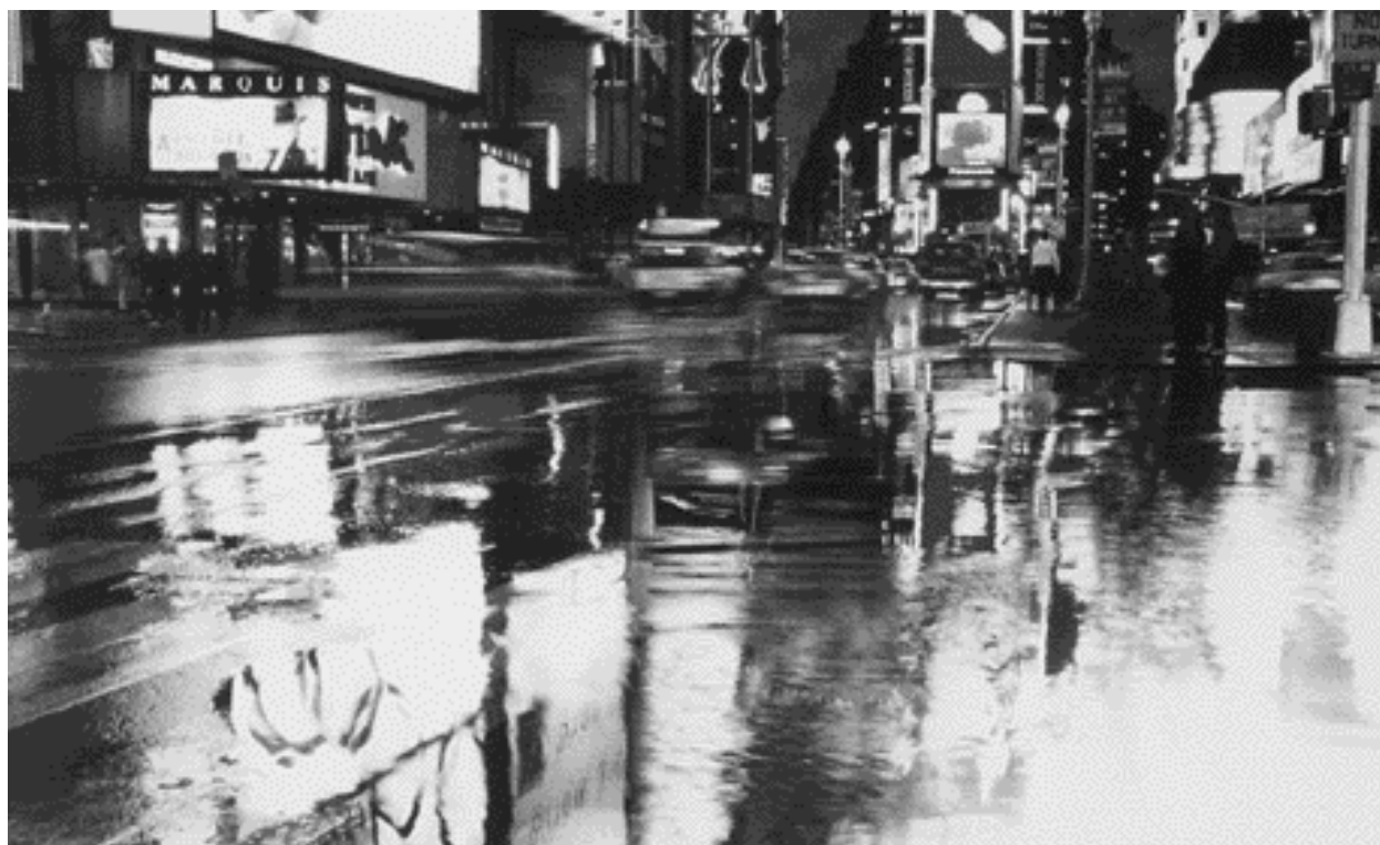
Nueva York, Estados Unidos

Sin duda, se pueden apuntar los logros notables del curso reformista: en menos de veinte años México se volvió un gran exportador de manufacturas pesadas y semipesadas, base poderosa de la producción y la exportación automotriz y electrónica y, en conjunto, sus ventas al exterior se multiplicaron por cinco. También, superó su condición de economía casi monoexportadora, dependiente en alto grado de las ventas foráneas de crudo, y atrajo montos considerables de IED. En muy poco tiempo, el país se volvió uno de los tres principa-