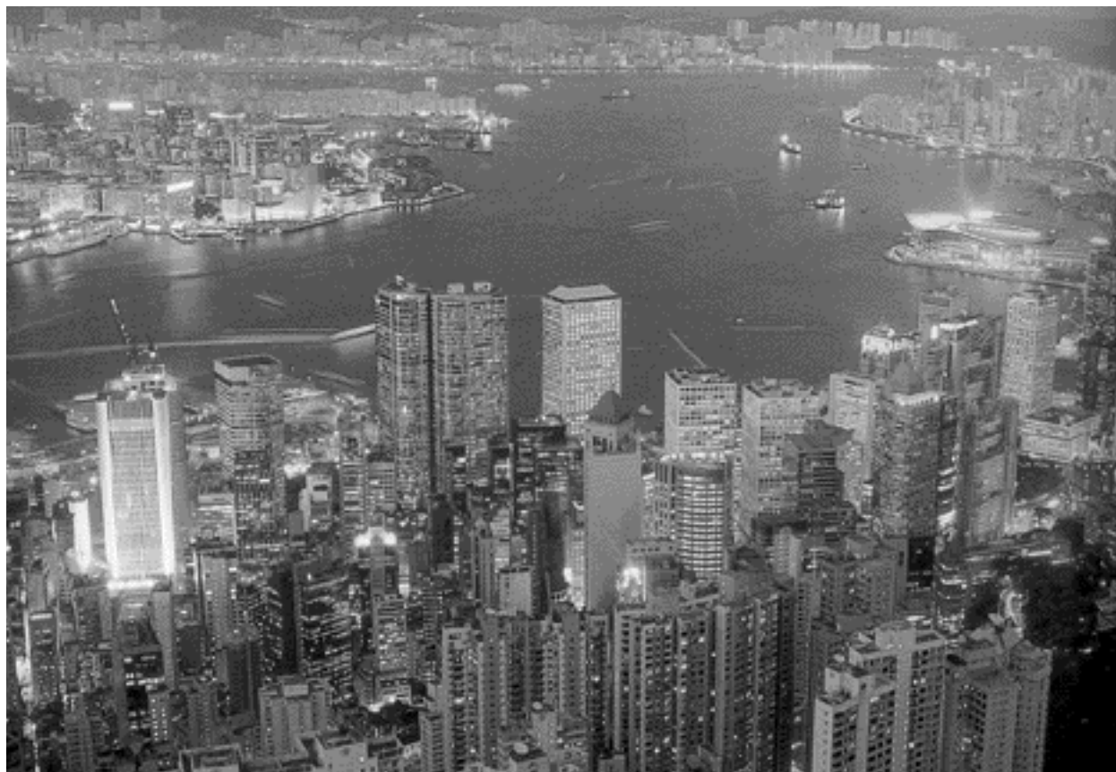
Hong Kong, China