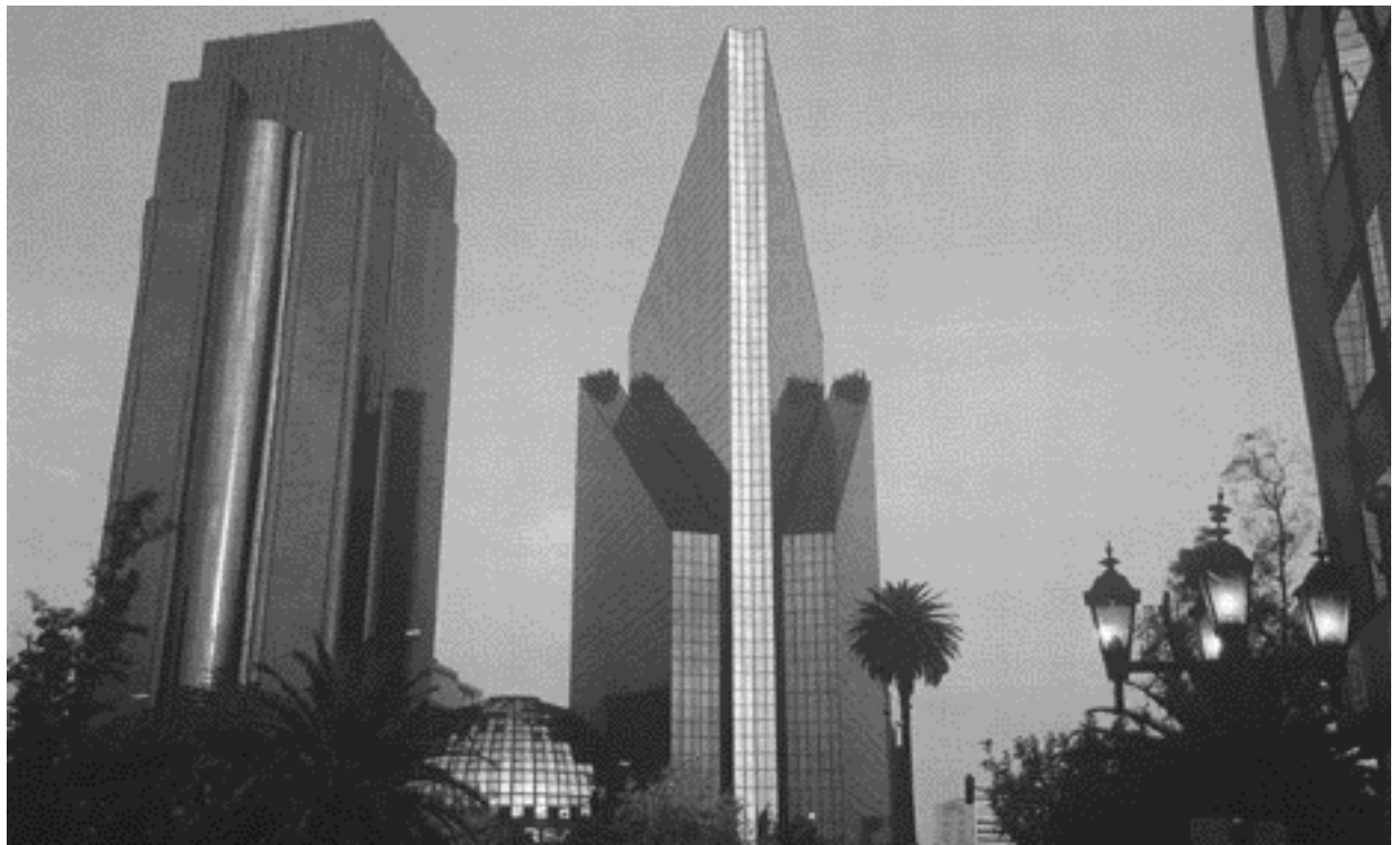
Edificio de la Bolsa Mexicana de Valores, Ciudad de México

les socios comerciales de los Estados Unidos y apareció en la escena comercial mundial como un nuevo y atractivo jugador de grandes ligas.