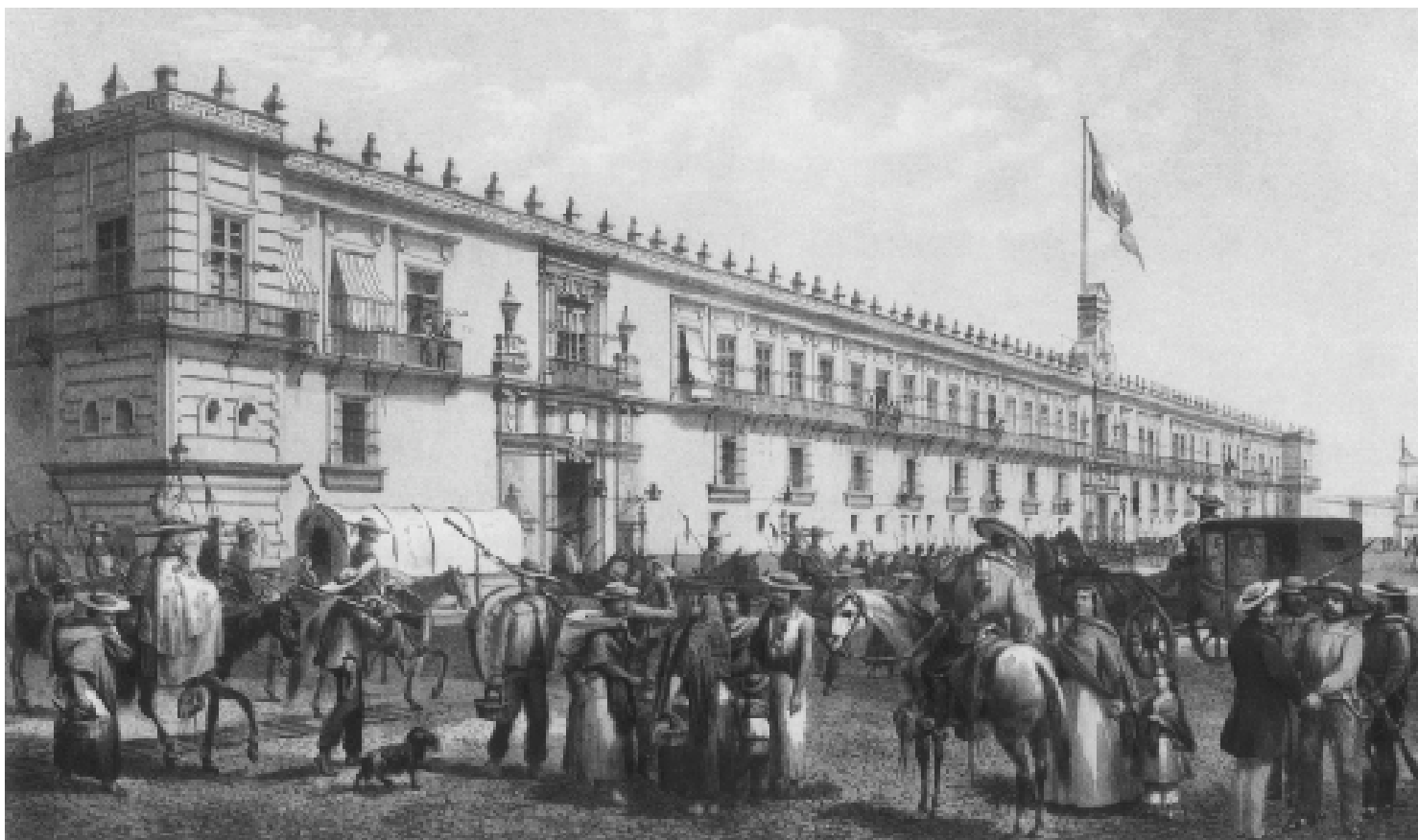
Entrada del Ejército federal el 10. de enero de 1861

logía de esa criatura fascinante y extraña, en estado constante de transformación, llamada Romanticismo.