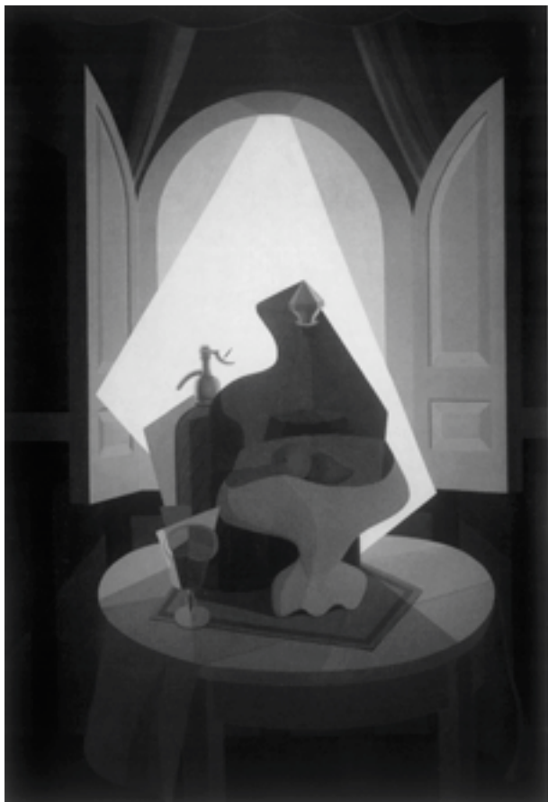
Emilio Pettoruti, Sol argentino , 1941

...y de los restos que quede de cada tiempo. En el caso del Holocausto que es el hecho que marca centralmente el siglo XX, fue necesario saber lo que hicieron Primo Levi y Jorge Semprún víctimas y sobrevivientes, respectivamente, de Auschwitz y de Buchenwald. Ellos salen al mundo y le proporcionan, como dice Primo Levi, “la materia prima de la indignación”, porque el poder nazi, que había organizado los campos de concentración, trató de borrar y disimular los rastros materiales de los lugares donde esa experiencia tuvo lugar. En ese sentido, aunque son incomparables las matanzas de América Latina con las matanzas del Holocausto, los criminales operan del mismo modo: borrar los rastros de sus crímenes. No hay ejército ni grupo paramilitar que conserve el registro de cuáles fueron sus crímenes. De ahí que en Perú se tuvo que organizar esa construcción de la verdad donde iban de pueblo en pueblo con funcionarios que llegaban a tomar las declaraciones de aquellos que habían sido víctimas tanto de Sendero Luminoso como del ataque de los paramilitares o del ejército. Ésa es, como dice Primo Levi, la materia prima de la indignación y sobre algunos hechos del pasado sólo queda esa materia prima. En muchos casos —en Chile o en Argen-