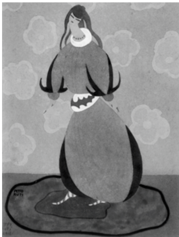
Emilio Pettoruti, Figura con flores , 1918

Esa frase forma parte de las conferencias sobre Kant, es uno de esos textos que a mí me ayudaron cuando estaba armando la complejidad de discusión que tiene Tiempo pasado... Cuando yo volví a esas conferencias sobre Kant, tuve la sensación de que había encontrado en Arendt exactamente la observación que necesitaba para mi razonamiento. Arendt pone una luz de alerta sobre la idea de que hay que estar muy próximo a la historia que se está narrando, tan próximo como está la primera persona que dice “a mí me sucedió esto” o “yo padecía tal cosa”. Arendt afirma que para entender, incluso, la propia experiencia, la más íntima, es necesario un acto de imaginación que aleje al sujeto de esa experiencia que le permita ponerlo en relación con otras experiencias, que le permita estructurar un mundo de sentido. Lo que Arendt discute precisamente es la raíz de la verdad testimonial, que afirmaría que cuando más cerca está uno de su propia experiencia mejor puede contarla. Arendt dice: tomemos una distancia; que la imaginación salga y entonces es posible ver la experiencia.