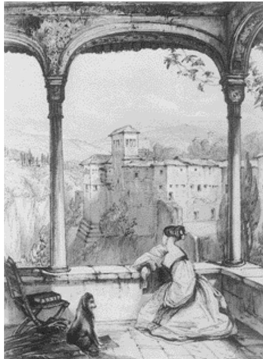
John Frederic Lewis, La Alhambra y Sierra Nevada desde el peñador de la reina , 1834