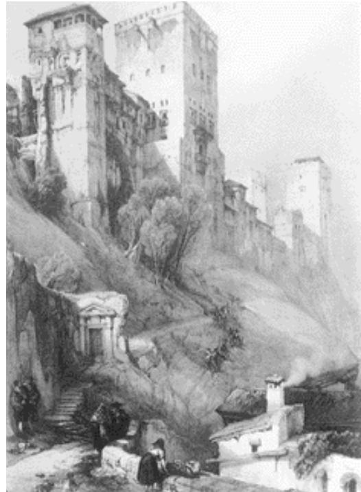
David Roberts, The Fortress of the Alhambra