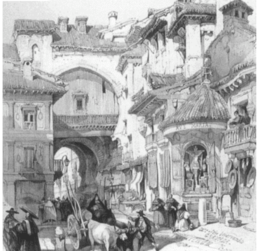
David Roberts, Puerta de Bibarrambra

Hasta aquí con una de las tantas anécdotas del maravilloso compositor de “Granada”. Ahora vayamos con uno de los mejores intérpretes de una de las canciones más famosas del mundo.