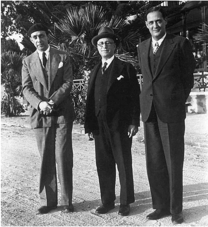
Daniel Cosío Villegas, Enrique Díez-Canedo y Salvador Novo, 1933